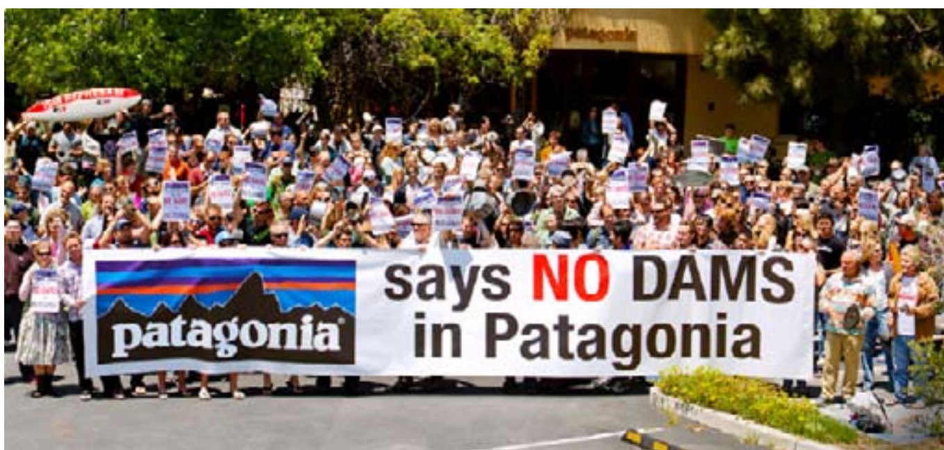
Протест против строительства крупной ГЭС в Патагонии, Чили.