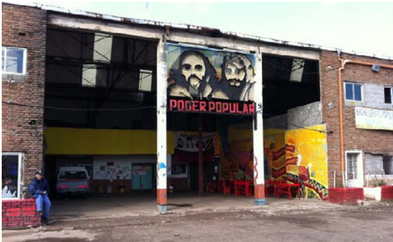
Заброшенная фабрика в Баррио-де-Ланус (Буэнос-Айрес, Аргентина), превращенная в образовательный центр.

Бенджамин Техерина, Университет страны Басков, Испания, председатель Исследовательского комитета 48 (Общественные движения, коллективное действие и социальные изменения), член Исполкома МСА, 2010-2014