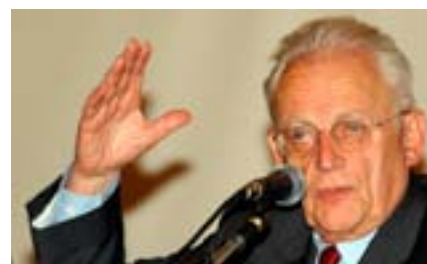
Ален Турен , всемирно известный социолог, рассказывает, как появился его теоретический подход и сформировалась новая перспективная методология изучения общественных движений. Он рассуждает о своем первоначальном оптимизме и нынешнем пессимистическом взгляде на общество.