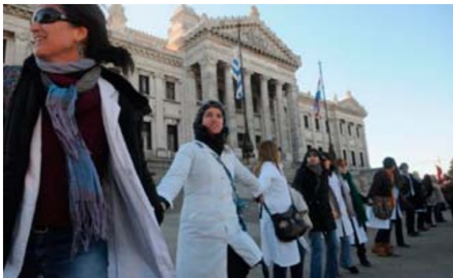
Протест учителей, окруживших здание парламента Уругвая.