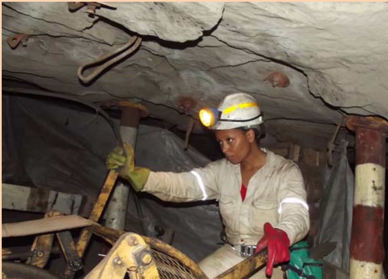
Асанда в забое.

прийти на шахту. Женщины, живущие дальше от шахт, обычно выходят из дома в 2 часа ночи. День начинается с дороги на работу на нескольких видах общественного транспорта: зачастую приходится ехать на автобусе из города в деревню, затем на такси из города до общежития, откуда очередной автобус довозит их до самих шахт. Это длинное, опасное и дорогое путешествие, на которое работники тратят почти треть своей небольшой зарплаты (120 – 150 долларов в месяц).