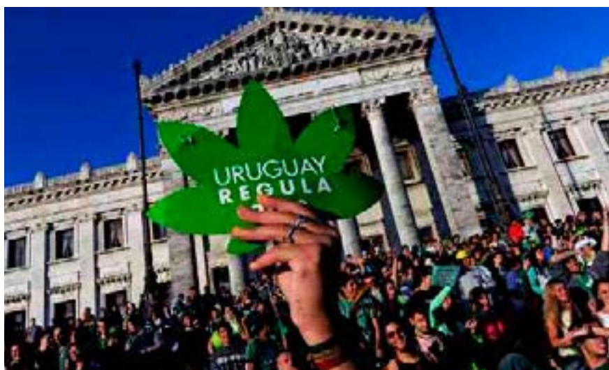
Демонстрация в поддержку Закона о легализации марихуаны у Дворца Легислатуры в Монтевидео.